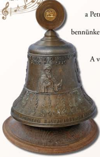
A győzelmi trófea