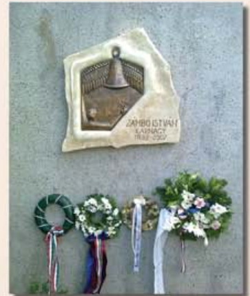
Emléktábla a Veszprémi Pantheonban