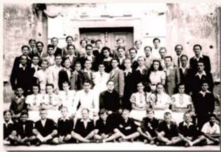
A piaristák vegyeskarjának csoportképe, 1948

Például 1950-ben, a Petőfi Színházban előadták Kodály Mátrai képek című művét. (Dr. M. Tóth Antal interjúja Lechner Lászlóval)