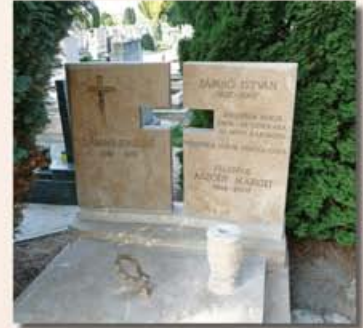
Síremlék a Vámosi úti temetőben