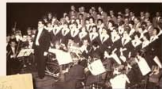
Debrecen, 1961: A kórus első hazai megemlékezése (bal oldali kép)

Így jutottunk el 1956-tól 1965-ig, az első nagy nemzetközi versenyig.”