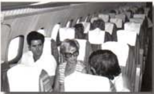
Utazás közben feleségével