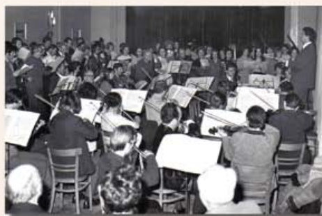
Oratórium-próba a Bányatársz épületében

Veszprémre figyelt az ország zenei közléte, amikor városunkat az új magyar zene fórumává avattuk 1965-től az Országos Kamarazenei Fesztiválok alkalmával. A Zenei Alap támogatásával jeles zenészerzőinket új művek írására ösztönöztük. Minden résztvevő együttes egy-egy új magyar kompozíciót mutatott be. A lezajlott tizenhárom fesztiválra mintegy hatvan új alkotás született. A veszprémi zenekarral, illetve a kórusal többek között Durkó Zsolt, Farkas Ferenc, Petrovics Emil, Szokolay Sándor műveit mutattuk be. A fesztiválokat a rádió, a tévé, a zeneszerzők, kritikusok nagy figyelmé kísérté.”