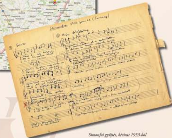
Simonfai gyűjtés, kézirat 1953-ból

— Lakóhelye és tanintézetének székhelye ● Gyűjtésének helyszínei