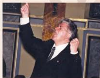
A 70. születésnapon