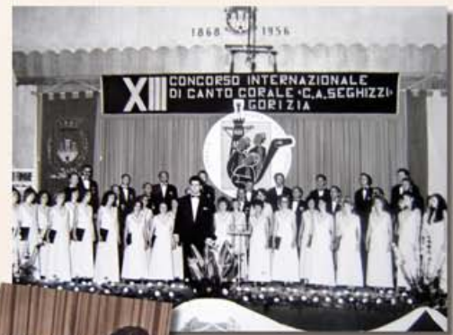
A gorizai versenyen résztvevő kórus Díjátétel Goriziában, 1974

A Folklór kategória győztese Llangollenben, 1976