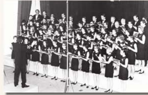
A debreceni Bartók Béla Kórusverseny színpadán - 1970

(Zámbo interjú, részlet – 1970. július 10, Hajdú-Bihari Napló)