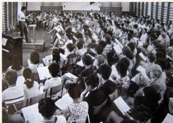
Próba az 1968-as Éneklő Héten