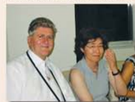
(1981. Bartók-ünnep Veszprémben, részlet Cziringáber János cikkéből)