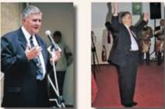
Karácsonyi koncerten, együtt a VVV-vel, 2004