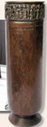
A debreceni serleg