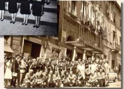
Petrarca színház - a verseny helyszíne