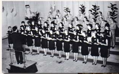
A vegyeskar Arezzóban