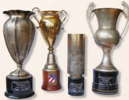
A gorizai díjak