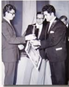
Újabb debreceni siker

„Magyar kórusnak könnyebb külföldön jó eredményt elérni, mint itthon. Az ok: a külföldi versenyeken egy-egy magyar résztvevő révén érvényesül a magyar előadói stílus temperamentuma, és átütő sikert hoznak a kitűnő kompozíciók. A debreceni Bartók Béla Kórusverseny azért volt nehéz, mert egyrészt sok kiváló magyar kórus versenyzett itt, másrészt külföldről is többszörös nemzetközi díj-nyertesek sorakoztak fel. Ezért tartom én Debrecent a versenyek versenyének, ahol a vegyeskari I. és a folklór I. díj különösen értékes.”