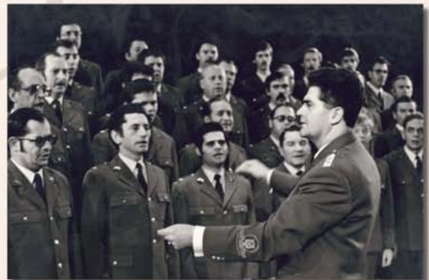
A Honvéd Férfikar karnagya