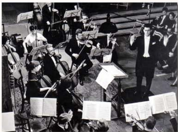
A Veszprémi Szimfonikus Zenekar az egyetemi Aulában

„A kórus és a zenekar, mint egy egyesület, abban a szerencsés helyzetben volt, hogy megerősödése, kibővülése után hármás műsorprofilot folytathatott: a cappella, azaz kíséret nélküli kórusdarabok, zenekari művek illetve közös produkciók, azaz kantáták, misék, oratóriumok.”