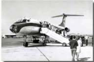
Utazás Barcelonába, 1972