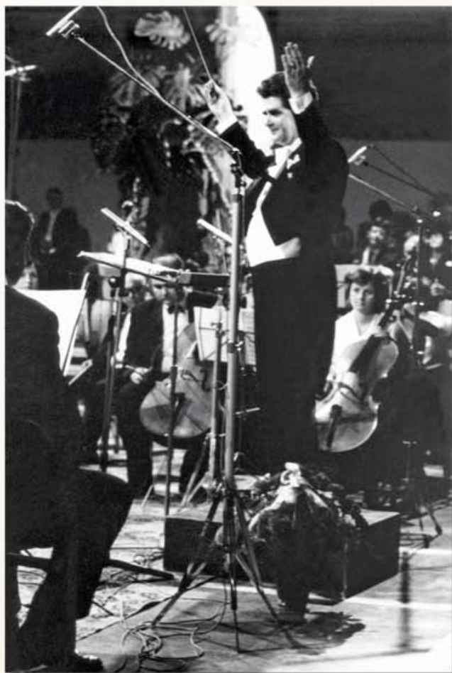
A zenekar élén, 1982