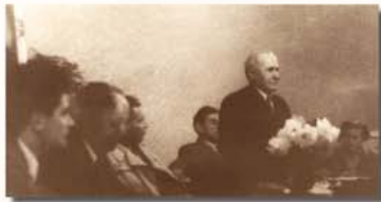
Az alapítás pillanata

„Mélto ének- és zenekart Veszprémnek – ez volt akkor a közvélemény jelszava. A felnőtt-együttesek újraélesztésére, új egyesület szervezésére több meddő kísérlet történt a háború után. Így nyitott, várakozásteljes légkör fogadott 1956 nyarán, amikor mint frissdiplomás karnagy, hazatértem Veszprémbe.”